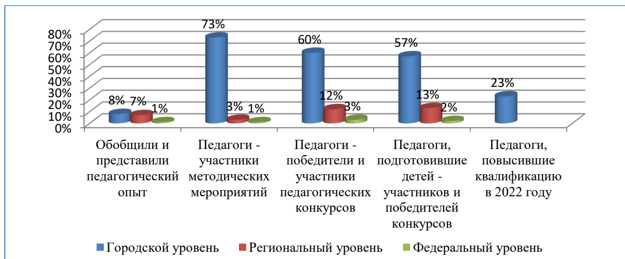
Рис. 2. – Показатели профессионального роста за 2022 – 2023 учебный год

Результаты некоторых показателей результативности/продуктивности профессиональной деятельности и профессионального роста представлены в рисунке 2.